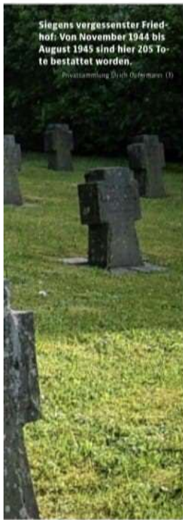
Siegens vergessenster Friedhof: Von November 1944 bis August 1945 sind hier 205 Tote bestattet worden. (1)

te Unterbringung von Ausländern in den Krankenhäusern. Krankenhausbaracken waren die Folge. Diskussionen über einen entsprechenden Standort im Arbeitsamtsbezirk Siegen zogen sich hin. Letztlich fand sich die Stadt Siegen bereit, ein Hilfskrankenhaus speziell für Ostarbeiter in der Fludersbach als Betriebsstelle des Stadtkrankenhauses aufzustellen.