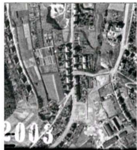
Auf dem Luftbild vom September 1944 sind die Baracken des Hilfskrankenhauses Fludersbach im unteren Bildteil zu erkennen.