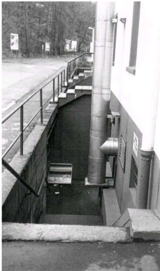
Auch zu Zeiten des Verbrauchermarktes erhalten blieb der Treppenberg, der in den Keller des Hilfskrankenhauses Fludersbach führt.

Bernd Plum will wissen, wer die Menschen waren, die in diesem Krankenhaus zu Tode kamen