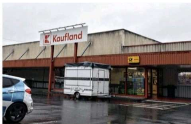
Unter dem Kaufland-Verbrauchermarkt sind die Keller des ehemaligen Hilfskrankenhauses. Hier wird bis Ende 2027 ein neuer Edeka-Supermarkt gebaut.

Als 1959 die Kaffeerösterei Georg errichtet wurde, war nur noch der Keller erhalten. Türen, Fenster, Lichtschalter findet der Archäologe noch vor, ein Teil davon wird in die Ausstellung des Aktiven Museums Südwestfalen übernommen. Der ursprüngliche Raumeindruck sei aufgrund der vorgenommenen Umbauten „nur sehr eingeschränkt erkennbar“, heißt es im Gutachten des Archäologen. Setzungsrisse und abgesenkte Böden ließen