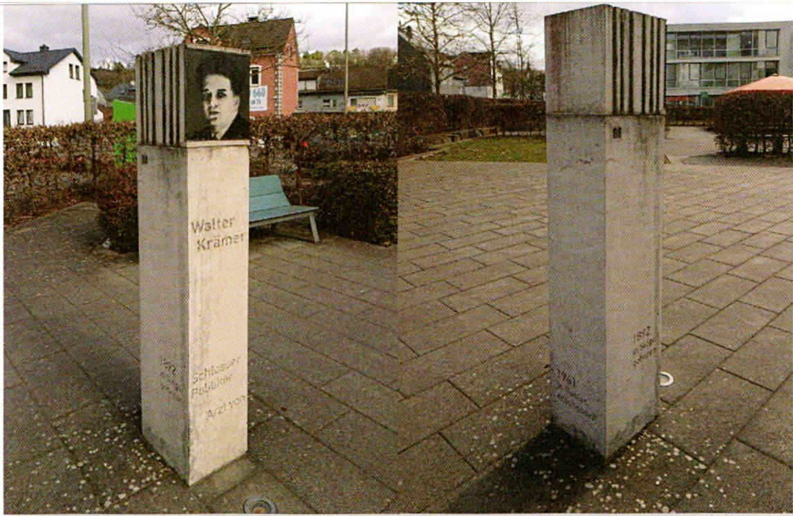
Stele auf dem Platz vor dem Kreisklinikum Siegen

Liesel Krämer ist eine Verfolgte der nationalsozialistischen Gewaltherrschaft zu sehen.