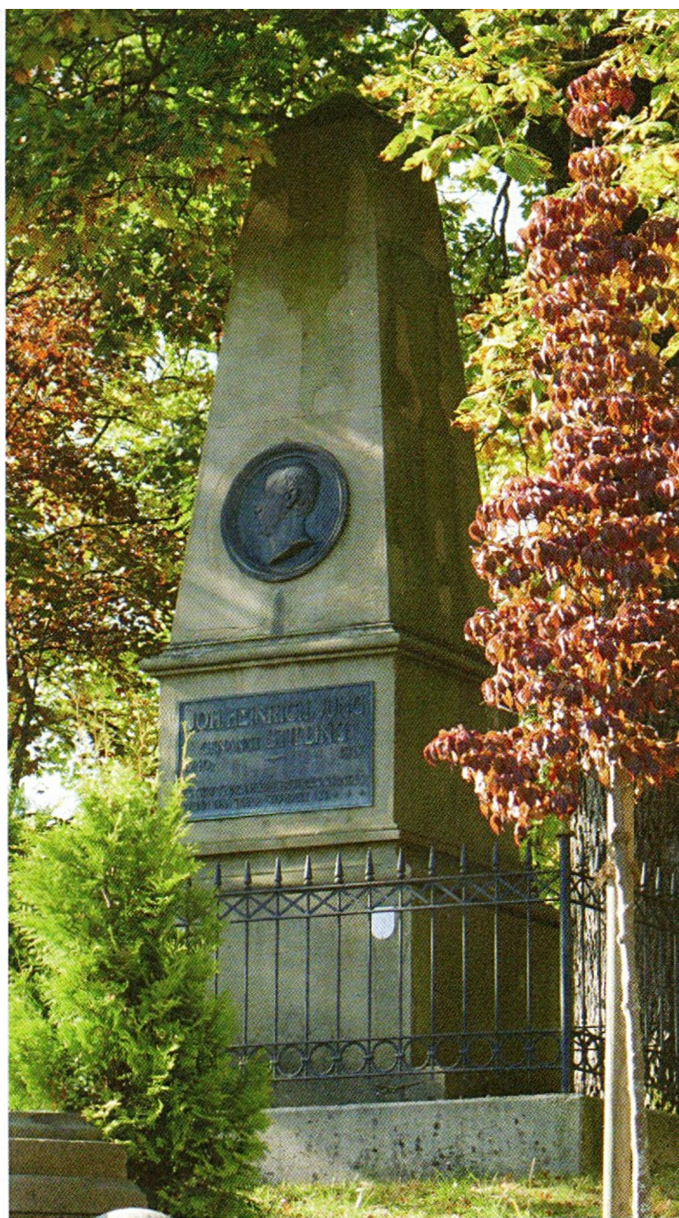
Das 1871 eingeweihte Denkmal für Johann Heinrich Jung-Stilling in Hilchenbach