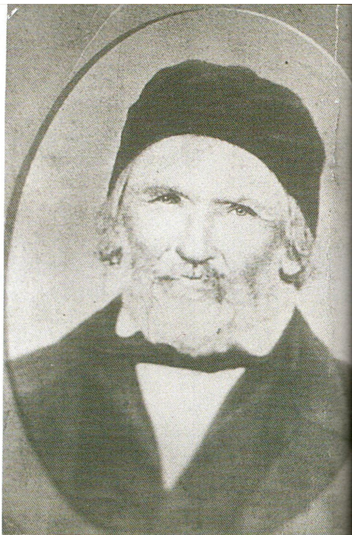
Porträt Johann Heinrich Reifenrath

Reifenrath wurde am 28. September 1785 in Hilchenbach als jüngster Sohn eines Bauern und Gerichtsschöffen geboren und folgte dort seinem Vater 1803 im Amt eines Gerichtsschöffen. Während der Franzosenzeit, als das frühere Fürstentum Siegen-Nassau zum Großherzogtum Berg gehörte, wurde er von 1809 bis 1813 „Maire“, also Bürgermeister, von Hilchenbach. Als solcher auch 1814 und 1815 bestätigt, wurde ihm das Amt 1817 unter preussischer Ägide erneut übertragen, und 1837 wurde er nach Einführung der revidierten Städteordnung von den neuen Stadtverordneten zum Bürgermeister gewählt. Er hatte das Amt also mit anfänglichen kurzen Unterbrechungen vierzig Jahre, von 1809 bis 1849, inne. Er war seit 1837 außerdem Amtmann für die umliegenden Landgemeinden und saß seit 1828 als Abgeordneter im Siegener Kreisrat. Dort setzte er sich für den Straßenbau ein. Gegen den üblichen Alkoholmissbrauch rief er Mäßigkeitsvereine ins Leben. Noch in seinem letzten Amtsjahr regte er den Volksunterricht an. 1840 erhielt er eine Rüge von der Arnberger Regierung, die auf mangelnde Umsetzung neuer bürokratischer Anforderungen hindeutet.