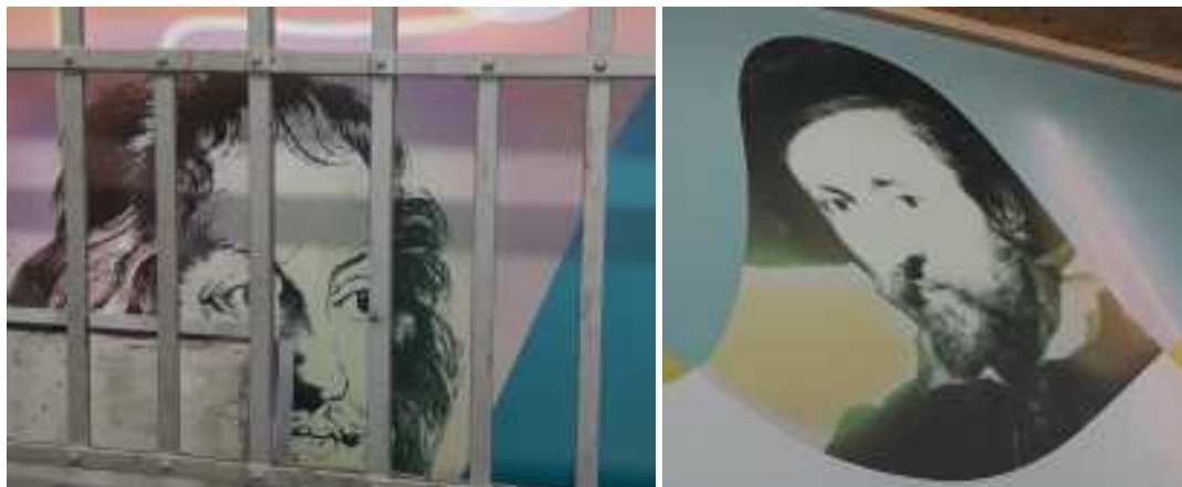
Detailaufnahmen: Fürst Johann Moritz (links), Peter Paul Rubens (rechts)

Element für Menschen von heute vom Baby bis zum Greis, zwischen denen sich markante Gesichter der Siegener Historie befinden.