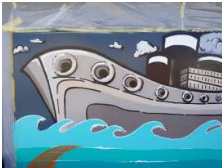
„re:form Solidarity“ (Ausschnitt)

niemanden zurück“ hieß das engagierte Motto des Künstlerkollektivs, das an all Diejenigen erinnern möchte, die körperlich, seelisch oder finanziell unter dem Corona-Virus zu leiden haben. Der Name „re:form“ erinnert daran, dass sich an dieser Stelle früher das Ladenlokal eines Reformhauses befand.