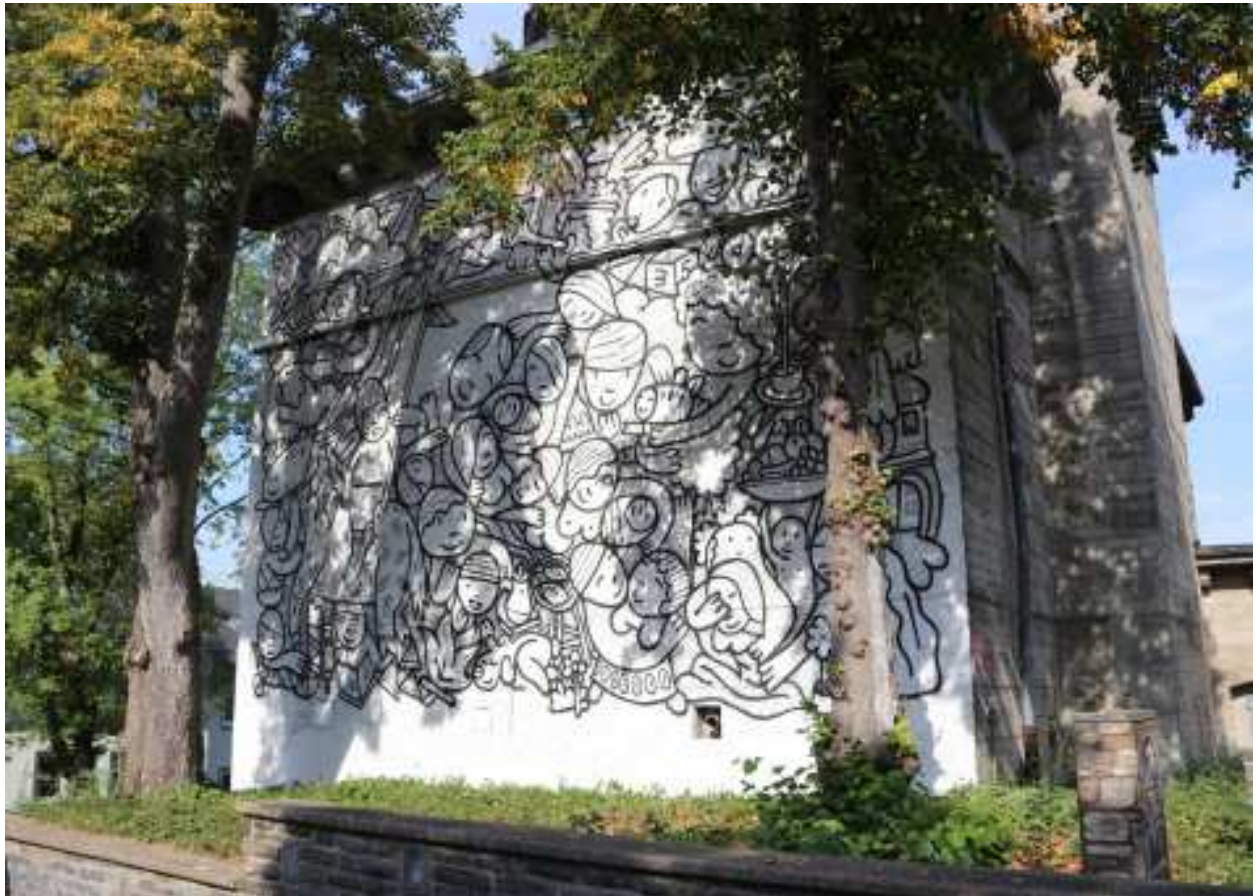
Bild: Gruppenbild (Boris Hoppek), Hochbunker Burgstraße